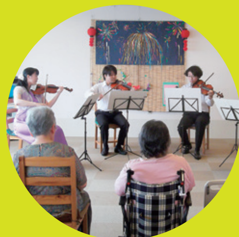
医学生時代・緩和ケア病棟での演奏ボランティア

医師にとって、自分の「軸」とか「根幹」というものはとっても大切。これは医学生にとっても大切なことだと思う。ぜひ学生時代に様々な経験をして、「自分の軸」を強くしてほしいと思います。