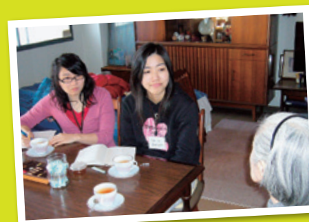
医学生時代・患者さん訪問インタビュー

また、大学は千葉にあったので、日常的に千葉民医連の学生サポートセンターの活動に参加していました。ランチやディナーといった食生活サポートも魅力でしたが、地元の医学生や医療学生の「たまり場」といった雰囲気が好きでした。